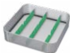
S20 - Cassetta Strumenti Serie MINI - 1 pz.