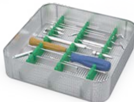
SET20 - Strumentario completo (Serie Mini)